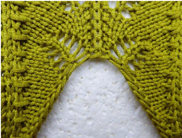
Strickmuster „Farnwedel“ Zipfel