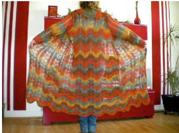
Mantel im Farnwedel-Muster