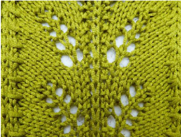
Strickmuster Farnwedel Vorderseite

ANMERKUNG: Der Anfang des Musters bildet große „Zipfel“ wie im dritten Bild sichtbar.