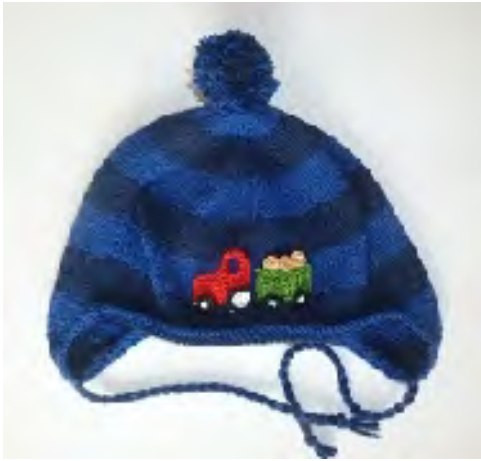
Anleitung für Traktor + Anhänger folgt